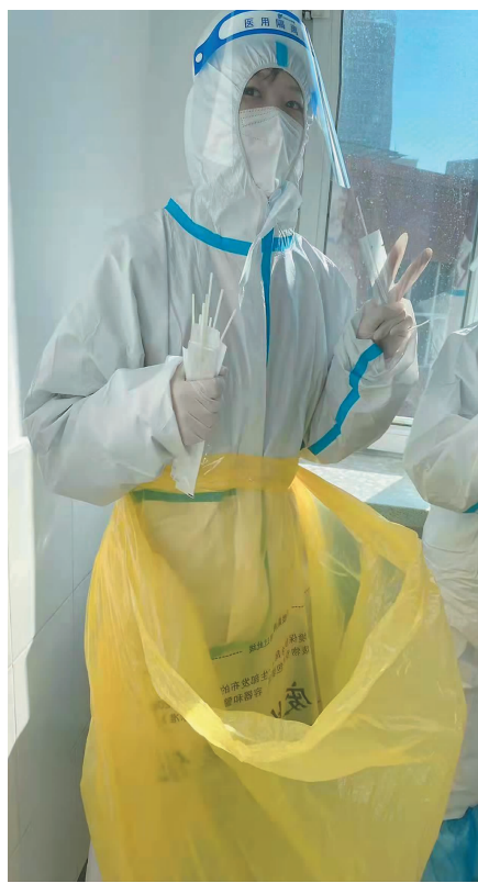
无私奉献的动画艺术学院师生志愿者为战胜疫情辛勤付出。