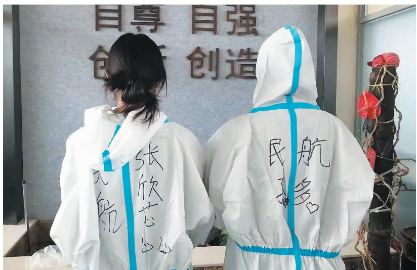
民航学院学生志愿者踊跃投入疫情防控志愿服务工作。

给予青年。”我们青年一代明使命,勇担当。民航学院学生积极响应学校关于疫情防控的号召,第一时间组建学生志愿者团队,踊跃投入疫情防控志愿服务工作。面对校园疫情防控的艰巨任务,吉林动画学院对学生各公寓楼实施封闭管理,尽最大努力保障在校学生生命安全和身心健康,并免费为学生按时送餐、配发防疫物资,保证学生“封寝”期间的基本生活需求。我院的首批志愿者已经冲上一线,为封闭管理期间的同学们定时发放三餐、口罩、饮