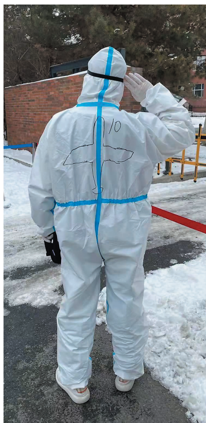
民航学院师生战胜疫情信念坚定不移。

2022年的长春,在迎接春天的道路上没有那么顺利,新冠肺炎疫情防控的严峻形势为这座美丽的春城按下了暂停键。面对疫情防控的艰巨任务,民航学院响应教育部的号召,共同应对疫情,积极开展线上工作安排。