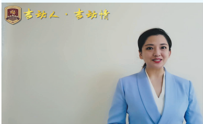
2014届播音与主持艺术系高改,是山西临汾广播电视台主持人。她饱含着对母校的眷恋之情说,我的母校吉林动画学院此时此刻正经受空前的考验。母校加油!