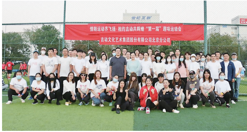
9月29日,吉动文化艺术集团北京分公司首届趣味运动会在北京市恒通商业园零秒足球场举行,公司4个代表队伍,80余人参加并合影留念。