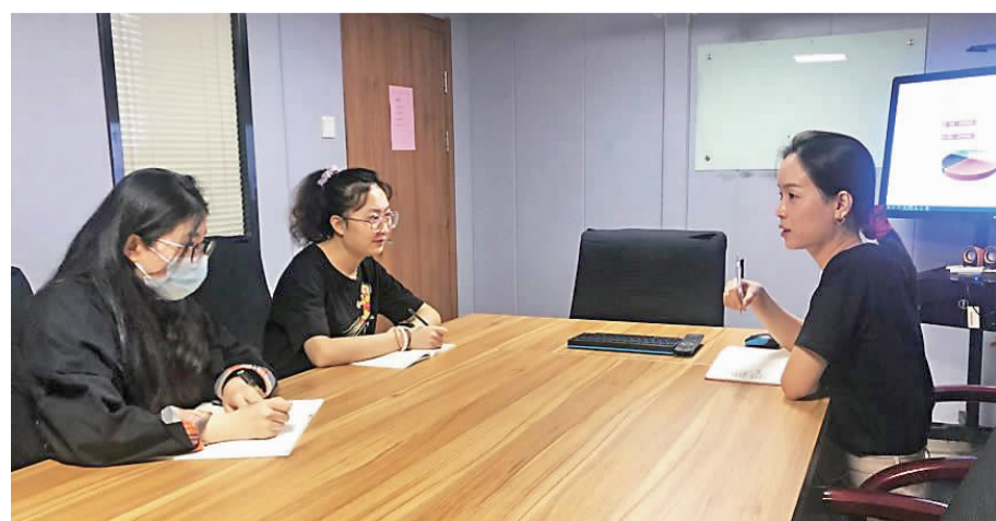
8月13日,影视事业群员工开展《2019—2020中国动画电影市场分析》培训。