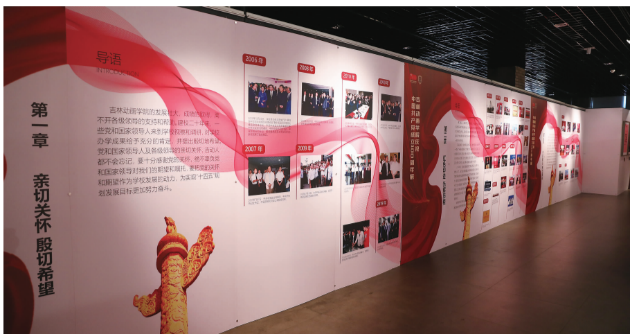
6月25日,“铭记百年历史,传承红色基因”吉林动画学院庆祝中国共产党成立100周年主题作品展开展。

动画学院在中国共产党的英明领导下学校砥砺前行发展壮大,走过了20年的光辉历程。20年来,学校为国家培养了四万多名文化创意产业优秀人才,成为全球规模最大的单体动画艺术高等学府,为繁荣我国的动漫教育事业做出了突出的贡献。先后被评为“国家动画教学研究基地”“国家动画产业基地”“国家文化产业示范基地”“全国毕业生就业工作典型经验高校”“全国第二批深化创新创业教育改革示范高校”“泛亚太地区动漫教育机构十强”和“吉林省特色高水平应用型大学建设高校”。本章将学校改革开放以来的大事记展示给大家,告诉大家是党的英明领导使我们开创了光辉历程。第三章:不忘初心,牢记使命。通过学校党建活动图片体现吉林动画学院从始至终始终按照党中央部署,不忘初心,牢记使命,强化政治功能,加强党组织建设,加强思想政治引领工作,使学校