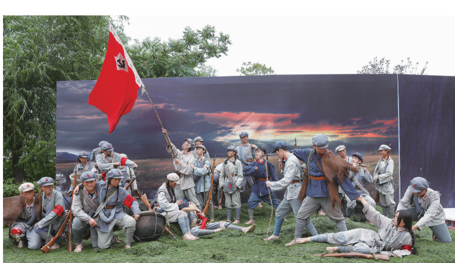
6月27日,我校庆祝中国共产党成立100周年系列活动之一——“中国共产党党史主题雕塑真人秀”庄严开展。

党史主题雕塑真人秀通过四个主题单元来展现中国共产党带领广大人民群众克服万难,奋勇拼搏,取得一个又一个伟大胜利的事迹。 长征主题单元,通过5-6个形体造型表现红军们经过艰苦努力,终于走出泥泞的沼泽草地,吹起了冲锋的号角,迎接胜利的曙光。赞颂红军乐观向上、同心协力、为了自己的理想、为了共产主义事业不怕苦、不怕累、不怕流血牺牲的革命精神;东北抗联主题单元,还原了东北抗联营地的艰苦生活,真实地反映了抗联英雄们为了反抗侵略者的压迫、不惧牺牲、奋战到底的大无畏精神。被压迫、女兵辛勤保障抗联战士后勤、卫生员紧急救治受伤的抗联战士、冷云班长带领的八名女抗联战士英勇投江,栩栩如生的雕塑,震撼人的心灵;改革开放主题单元,展现改革开放40多年取得的伟大成就!世界第一大的天眼、蛟龙号、港珠澳大桥、航空母舰山东号、中国醒狮、长征火箭、高铁车头等道具元素来体现