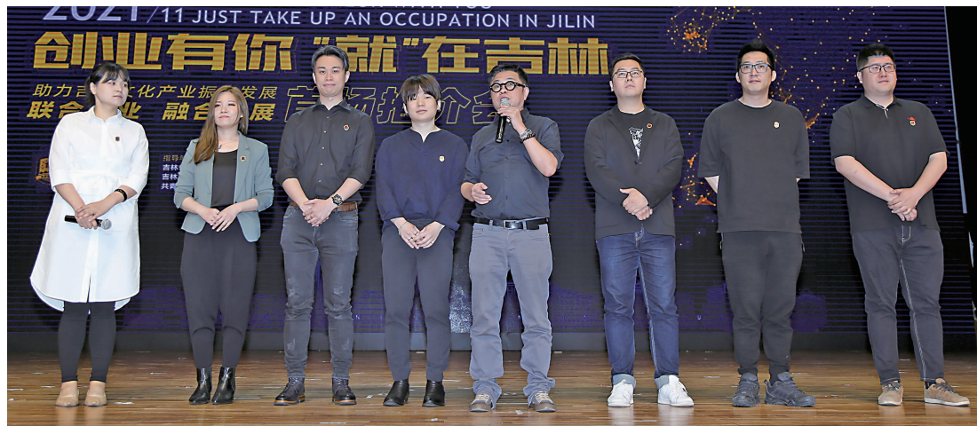
本次推介会上参与路演嘉宾合影。

本报讯 6月11日,由吉林省教育厅、吉林省人力资源和社会保障厅、共青团吉林省委联合指导,吉林动画学院、吉动文化艺术集团主办的“创业有你‘就’在吉林”助力吉林文化产业振兴发展首场推介会在吉林动画学院文化艺术中心一楼国际会议厅隆重召开。吉林省教育厅副厅长、党组成员许世彬,吉林省人力资源和社会保障厅副厅长、党组成员黄明,共青团吉林省委副书记苏建国莅临推介会,吉林动画学院院长、校长郑立国参加了会议。全省近30所大学的1000余名文创专业毕业生来到现场,数名业界专家就市场现状、行业发展、产品特点、产业概况、就业情况以及人才引进政策等进行推介。