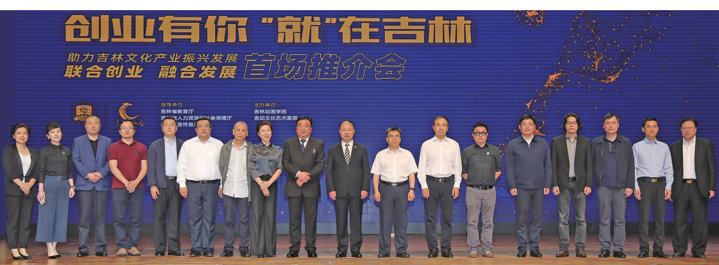
6月11日,由吉林省教育厅、吉林省人力资源和社会保障厅、共青团吉林省委联合指导,吉林动画学院、吉动文化艺术集团主办的“创业有你‘就’在吉林”助力吉林文化产业振兴发展首场推介会在吉林动画学院隆重召开,与会嘉宾合影留念。

吉林动画学院始终坚持“学研产一体化”的办学特色,构建了“专业、职业、就业、创业”相融合的实践教学体系和创新创业体系。建立了以“市场高端项目”为载体的实践实训平台,引进具有市场价值的文创项目,吸纳社会优秀创业人才。面向吉林省高校大三、大四学生提供开放项目实训平台,形成“以产业带动创业,以创业带动就业”有效机制。学校依托数字技术、影视娱乐、动漫游戏等特色产业基地和模块,整合行业资源,联合省内30余所高校为省内文化产业振兴以及广大高校毕业生留省就业、创业搭建了广阔平台,为努力建设吉林动漫影视产业集聚区,为吉林省文创人才留省,文化产业集聚贡献力量。吉林大学、东北师范大学、吉林艺术学院等相关院系领导与会。(王舜)