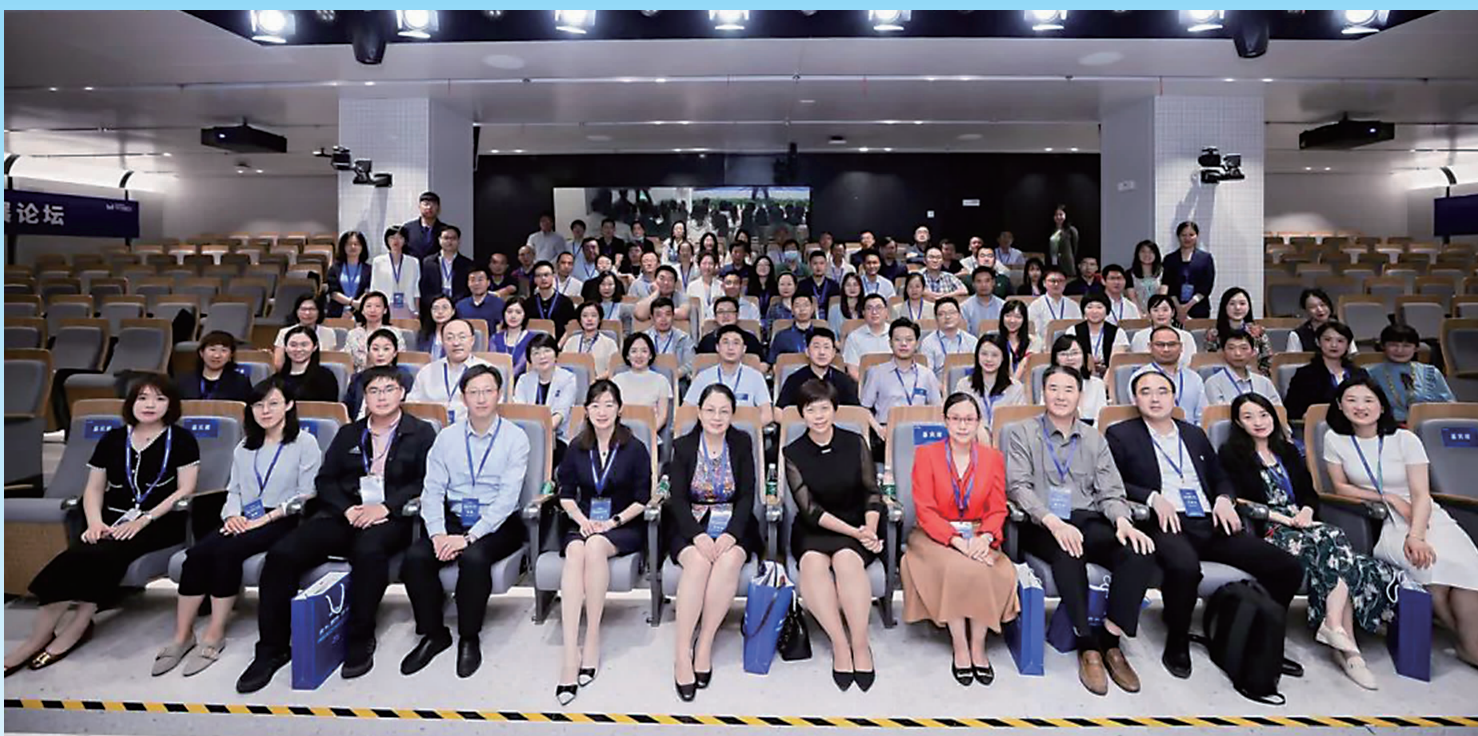
日前,字节跳动2021校园人才培养与发展论坛在北京召开。吉林动画学院作为唯一受邀参会的民办高校获得了字节跳动所颁发的“最佳校园人才合作伙伴”奖。

(上接1版) “文化强国”与每个人都息息相关,更是当代青年大学生的神圣责任和光荣使命。正如习近平总书记所讲:“当代中国青年是与新时代同向同行、共同前进的一代,生逢盛世,肩负重任。”建设“文化强国”是我们共同的责任和使命:一定要坚定中华文化自信,增强国家文化力量,弘扬正气,传递正能量,自觉维护国家发展利益和文化安全,致力于在全球范围内弘扬中华民族优秀传统文化。一定要深耕专业领域,勇于创新创业,坚持把社会效益放在首位,提升经济价值、社会价值和文化价值,推动中华优秀传统文化创造性转化创新性发展。尤其是动漫游、影视、设计体系的“文创青年”,更要勇立潮头,引领文化产业消费市场,不断创作出思想精深、艺术精湛、制作精良的精品力作,打造出影响一代人、甚至几代人的经典IP,引导消费者尤其是青少年,更好、更深层次地认知认同、传承弘扬中华优秀传统文化。