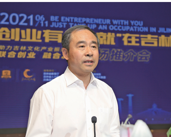
吉林省教育厅副厅长、党组成员许世彬在推介会上致辞。