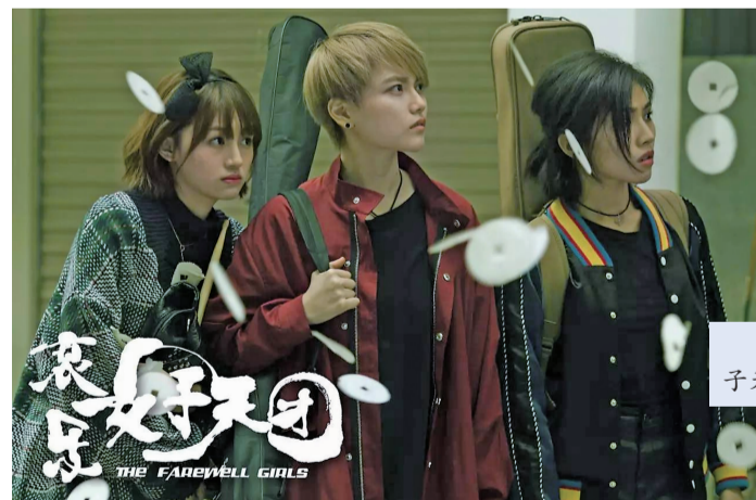
《哀乐女子天团》剧照。