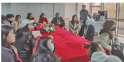
活动月期间,影视造型学院学生就业情况交流会。