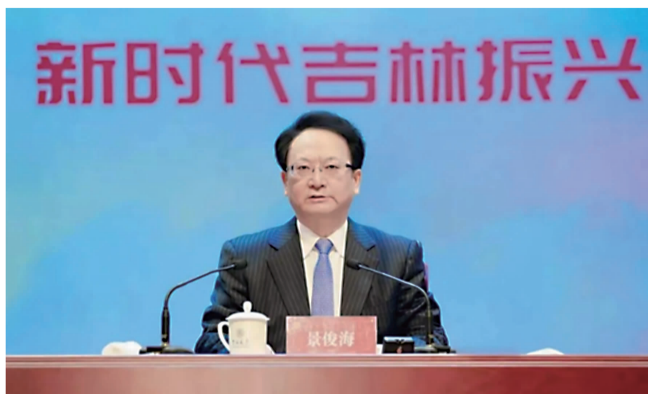
4月8日,由吉林省教育厅主办的“创业有你‘就’在吉林”助力新时代,吉林振兴发展首场宣讲报告会在吉林大学举办。省委书记景俊海以“省委书记发出邀请:创业有你‘就’在吉林”为题作了首场宣讲报告。

心中有信仰,脚下有力量。会上,省委书记景俊海以“省委书记发出邀请:创业有你‘就’在吉林”为题作了首场宣讲报告。“教育兴,则国家兴;教育强,则国家强。”景书记结合吉林振兴发展的实际,结合自身丰富的阅历,深入地思考以及领导工作的实践,从吉林省的过去、当下和未来相贯通的大事业出发,对吉林发展的重大机遇、良好环境、美好前景进行了深入的介绍,对广大高校的毕业生发出了“扎根吉林 圆梦起航”的诚挚邀请,也对全省的青年大学生提出了殷切的期望,鼓励青年大学生要珍惜时代机遇,当好新时代的追梦人。他指出,当代青年大学生一要坚定理想信念,让信仰之光照亮前行的道路。始终坚定理想信念,增强“四个意识”,坚定“四个自信”,做到“两个维护”;二要永葆初心使命,以赤子之心实现人生价值,奉献祖国、奉献人民、奉献社会。加强理论文化知识学习,提高思想道德修养,夯实发展根基;三要时刻砥砺