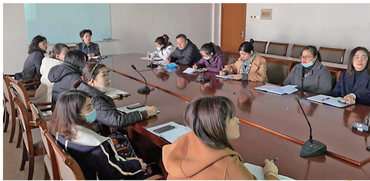
3月10日,招生与就业发展中心组织召开吉林动画学院首届就业活动月工作部署会议。