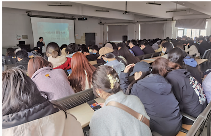
活动月期间,游戏学院邀请有海外留学背景的教师为有留学需求的学生开展《海外留学及行业分析讲座》。

地址:吉林省长春市高新区博识路168号 邮箱:jljh2000@sina.com 学校网址:http://www.jlai.edu.cn 咨询电话: 学校招生办:0431-87021922 动画艺术学院:0431-87019956 游戏学院:0431-87021907 设计学院:0431-87019924 文化产业商学院:0431-87021941 虚拟现实学院:0431-81310821 (曹丽丽)