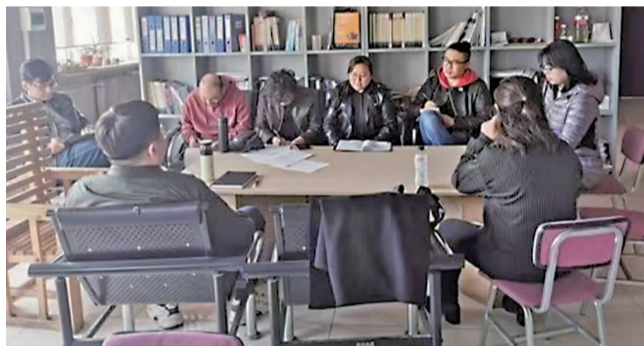
活动月期间,设计学院就业讨论会。