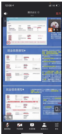
动画艺术学院大四毕业生线上培训会。