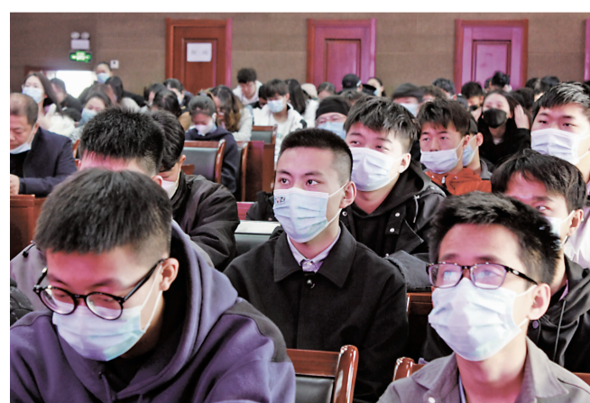
4月9日,由吉林省教育厅主办的“创业长春 梦想成真”——助推新时代长春振兴发展宣传推介会在吉林大学举行。我校副校长王晓岩、校长助理彭巍带领各学院相关负责人、招生与就业发展中心及创新创业孵化平台相关负责人,部分教师、辅导员和学生共同观看了视频直播。

在市委、市政府的领导和支持下,未来,吉林动画学院将全力以赴为长春经济社会发展提供更多高素质应用型人才支撑,为产业集聚区注入创新能量,推动长春成为吉林转型、升级的动力源,在新时代新征程上,展现新作为,做出新贡献!(千千做 耿英辉 臧寒雪)