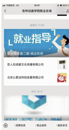
招生与就业发展中心就业指导推送。