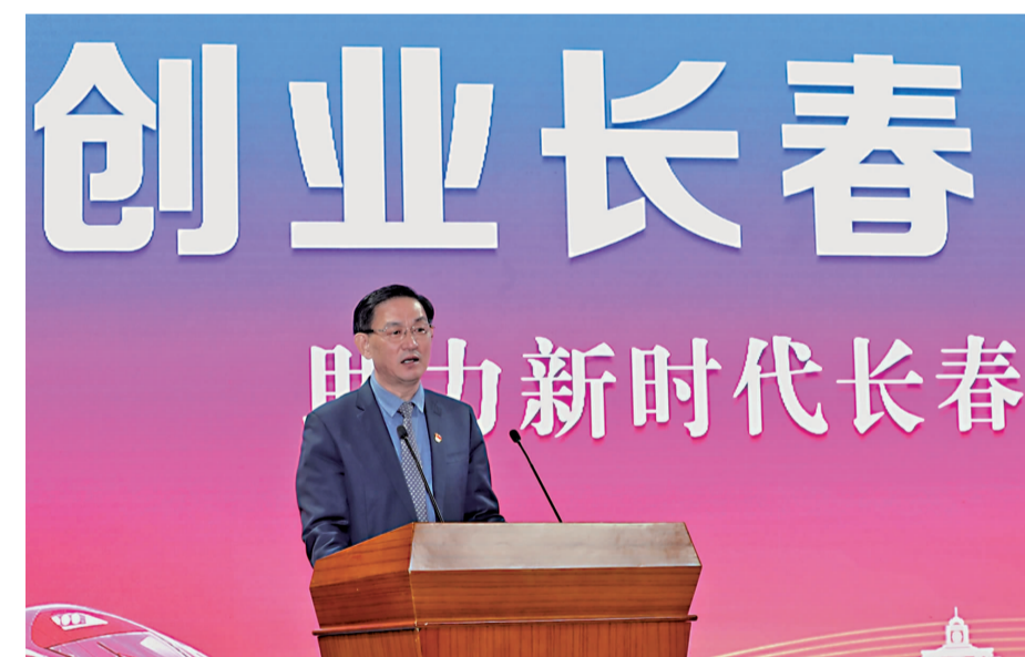
4月9日,由吉林省教育厅主办的“创业长春 梦想成真”——助推新时代长春振兴发展宣传推介会在吉林大学举行。长春市市长张志军通过视频直播的形式,为全市大学生作推介报告。

创业有机会,发展有平台,创业有空间。长春市市长张志军在“创业长春 梦想成真”——助推长春现代化都市圈建设市长宣传推介报告会上,通过实力长春、活力长春、美丽长春、潜力长春、魅力长春五大部分对长春发展的良好环境、美好前景进行了深度推荐,同时也对市委、市政府鼓励人才留长一系列就业政策进行了深入解读,向广大高