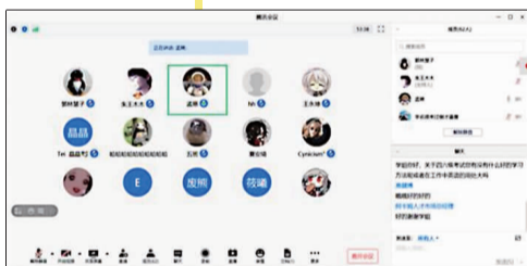
虚拟现实学院优秀毕业生线上经验分享。