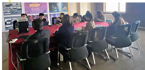
活动月期间,国际影视特效学院召开就业工作会议。