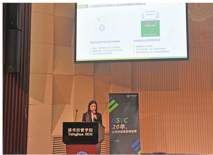
2019年,我校创新创业社团的“绘乡一设计”团队参加全球创新创业大赛活动。

2020年11月,为推动学生在社会企业创新中发挥更大作用,助力社会企业家精神的传播,成思危基金和创青春大赛组委会合作创立“成思危社会企业奖”,旨在奖励那些用商业手段系统化解决社会问题的社会企业。“绘乡计划”全程参与了成思危社会企业奖的整体设计,