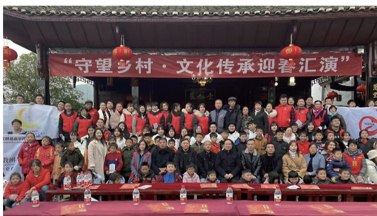
2020年1月,甘露大学生志愿者协会参加贵州寒假支教活动。

作为新时代青年,践行雷锋精神是时代责任,因为雷锋说过自己活着就是为了使别人过得更美好。甘露大学生志愿者协会的义举正是雷锋精神的体现,为疫情防控注入青年力量,成为疫情笼罩之下的一束暖阳,温暖人间三月天。(于千傲 刘清)