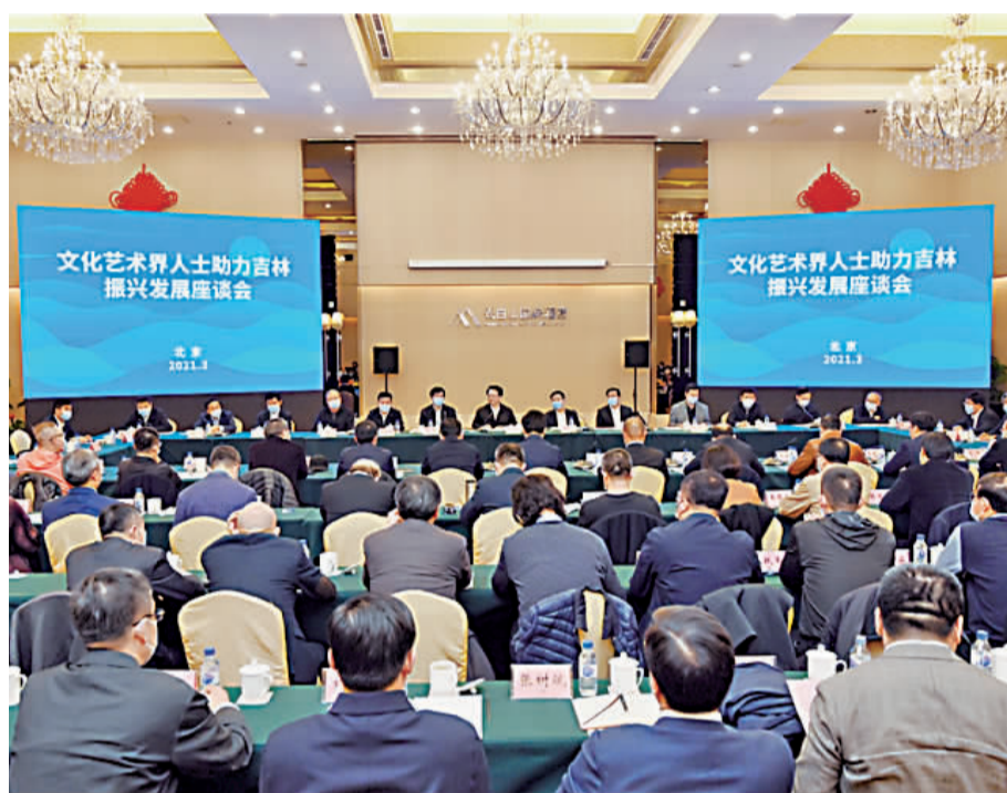
3月13日,文化艺术界人士助力吉林振兴发展座谈会在北京召开。

3月13日,文化艺术界人士助力吉林振兴发展座谈会在北京召开,来自新闻界、文艺界近百位知名人士齐聚一堂,共叙友谊、共话合作、共谋发展。中宣部常务副部长王晓晖,中国文联党组书记、副主席李屹出席座谈会并讲话。省委书记景俊海主持座谈会。省委副书记、省长韩俊介绍吉林经济社会发展情况。 座谈会上,薛继军、刘云志、张宏、陈临春、张建华、李岩、周茂非、曹华益、李路、闫学晶、王黎光、俞峰、廖祥忠等文艺界知名人士先后发言,围绕文艺作品创作、人才联合培养、冰雪文化推广、二人转艺术传承等方面建言献策。文化和旅游部副部长李群,中国作协副主席吉狄马加,中央广播电视总台副台长阎晓明,中国网络社会组织联合会会长任贤良,光明日报社总编辑张政,新华社党组成员、秘书长宫喜祥,国家广播电视总局电视副司长高长力,人民日报社新闻协调部主任温红彦讲话,充分表达了强化文化旅游合作、大力宣传报道吉林、携手发展网红经济等意愿。 王晓晖表示,我们要大力宣传吉林经济社会发展取得的新进展、新成效、新经验,支持吉林振兴影视产业、发展动漫产业,深入挖掘特色资源、发展区域特色文化,抓好文艺创作生产及相关文化活动,鼓励作家和艺术家