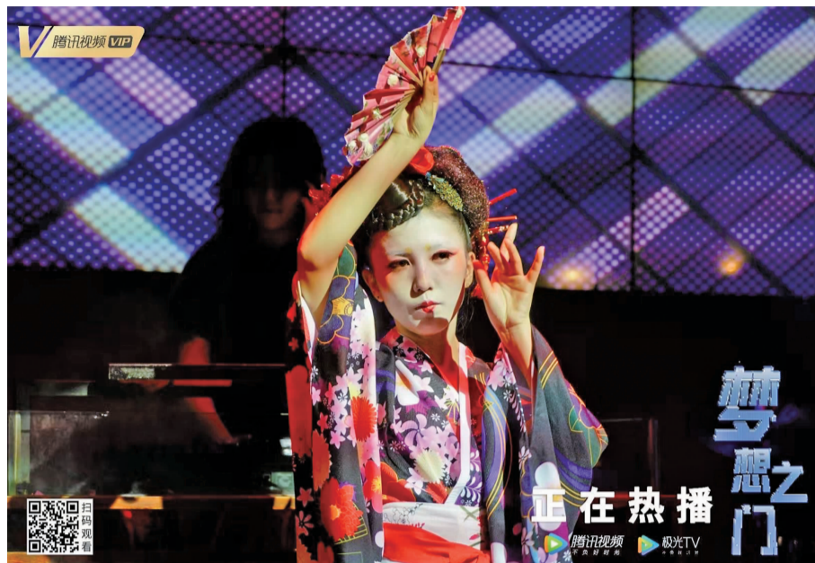
校园青春励志电影《梦想之门》，2月21日起在腾讯视频独家上线。

影片中大量的高燃悬疑镜头抓人眼球，生命倒计时的高能烧脑场面、女孩们凭空消失的惊悚悬疑气氛、看似美好光鲜其实暗藏