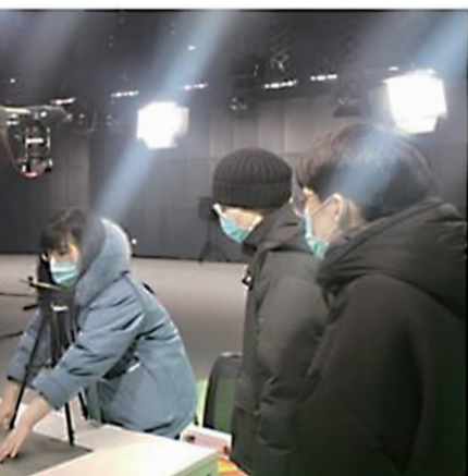
2021年影视事业群各模块有序开展各项工作。