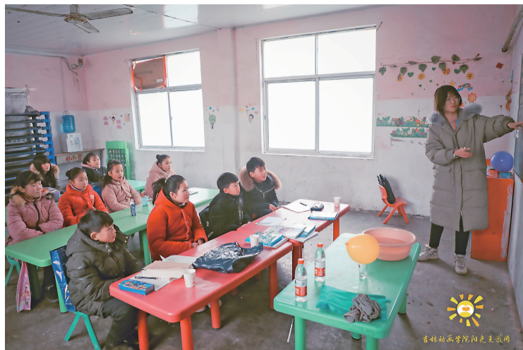
2020年1月,阳光支教团学生在河南袁庄智慧幼儿园进行支教活动,给孩子们上课。

“阳光启梦,尽心而行”,2021年是阳光支教团在公益路上的第八个年头。作为吉林动画学院目前规模最大、最专业、最早涉及支教的公益社团,他们的足迹已遍布了祖国各地20多所乡村小学,举办了大大小小300多场公益活动。 大山给予了你们宝贵的资源,却阻挡了孩子们眺望的视线。在大山的另一头,500多名阳光支教团的志愿者背起行囊,走进大山,从衣物募捐到短期支教,从微心愿活动到阳光助学资助,他们炽热的心为5000多个乡村孩子带去了温暖和希望。