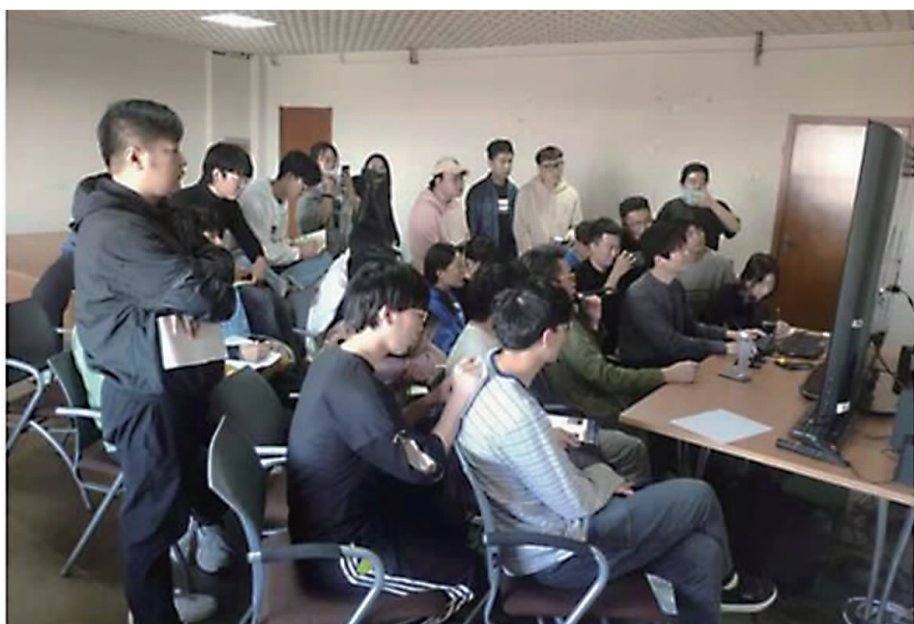
2021年，互创事业群全力打造全民学动画、学游戏、学漫画的素质教育平台。

本报讯 近日，经过运营与产品开发团队的不懈努力，三味漫画平台的付费阅读功能已完成开发。新版本春节期间已在小米、VIVO等安卓应用市场陆续上架，以后还将在苹果应用商店上架。