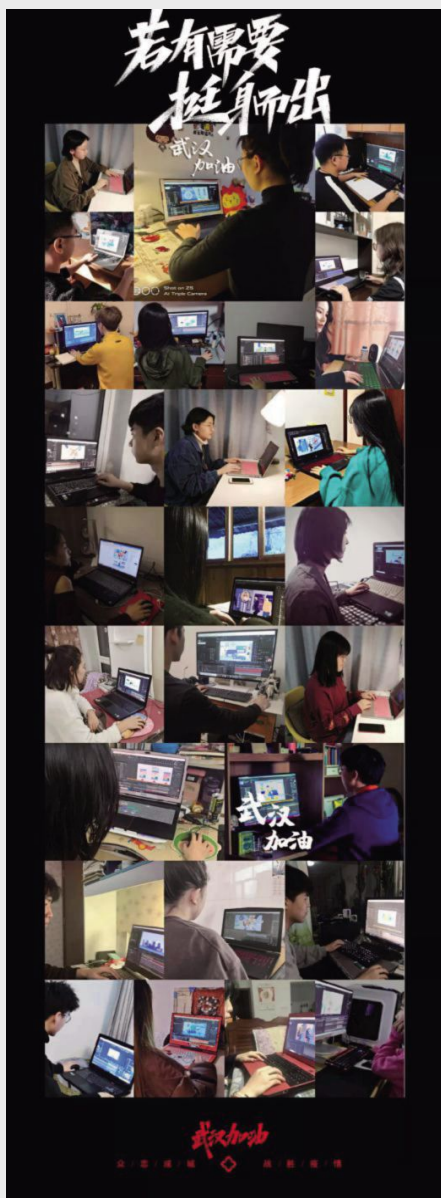
我校动画艺术学院新媒体动画系教师带队,30余名动画艺术学院新媒体动画专业学生参与,仅用时3天就完成了《上班族战“疫”指南》的创作。

2020年伊始,一场突如其来的新冠肺炎疫情蔓延,中国人民进行了一场严峻的疫情阻击战。在疫情防控的关键时期,党中央、国务院作出重要部署,省委、省政府及时启动了重大突发公共卫生事件一级响应,全省上下已形成强大的防控工作合力。为全面贯彻习近平总书记的重要指示精神,落实党中央、国务院决策部署和省委、省政府、省教育厅工作要求,吉林动画学院及平台建设与管理中心号召“平台”师生发挥专业特长,用文化创意作品阻击新冠肺炎疫情,弘扬抗击疫情主旋律,宣传防疫科普知识,凝心聚力,鼓舞斗志,与全国人民携手同心抗击疫情。