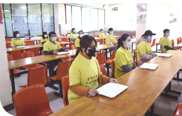
用餐完毕后,戴上口罩将餐具送回餐具回收处。