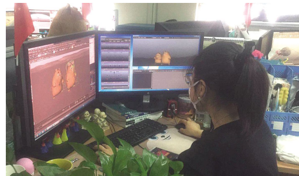
复工后,生产部模型组、材质组、绑定组加班加点赶制《电脑都市传奇》项目。

余人。复工后,天博公司各部门各司其职,根据项目档期安排,按部就班有序生产。今年创意制作事业群项目制作时间紧、任务重。目前,公司进行的生产项目为《青蛙王国之极限运