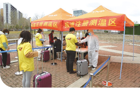
到校下车进入注册区,志愿者对学生携带的行李进行消毒。