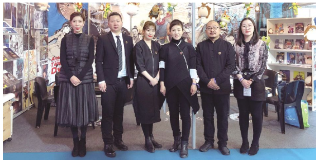
吉林动画学院、吉动文化艺术集团参展团在展位前合影留念。

吉林动画学院、吉动文化艺术集团专注原创,立足国际视野,在“走出去”的同时,关注国际优质IP。在参展期间,与包括法国、美国、德国、西班牙等20多个国家和地区参展商互访,进行积极的探讨交流。双方就漫画IP授权、漫画IP