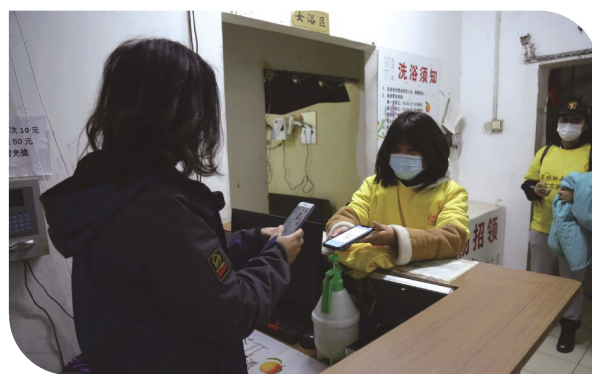
学生洗浴先预约,再按约定时测温进入。