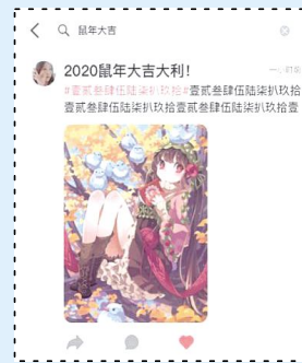
小宇宙社区新增搜索功能。

发现页的内容和形式变得更加丰富。新增加了纯文字的展示,这个功能使用户可以编辑属于自己的文案内容,使主页变得更加有趣;增加“文字+照片”的展示方式,用户可以在文案的基础上,再配上自己喜欢的精美图片,来丰富属于自己的小宇宙社区。在发现