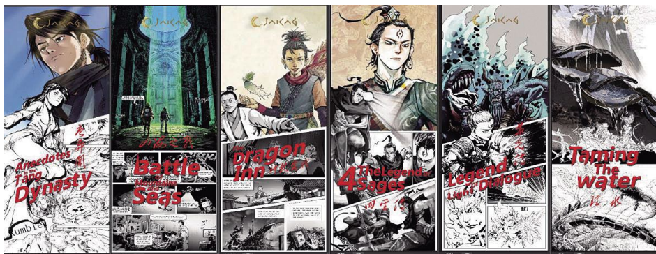
吉林动画学院、吉动文化艺术集团漫画作品展示。

展会期间,参展团一行参观了法国“作者之家”、法国国立游戏及数码互动媒体学院、欧洲高等图像学院等