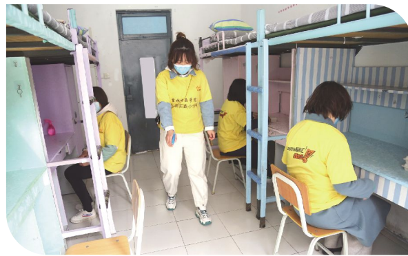
学生寝室定时进行消毒。

餐后,到指定地点取餐。入口测温进入食堂,间隔1米以上,档口前排队选餐,无接触取餐、付款,指定座位同向入座,摘下口罩用餐,间隔1.5米以上。用餐完毕后,戴上口罩将餐具