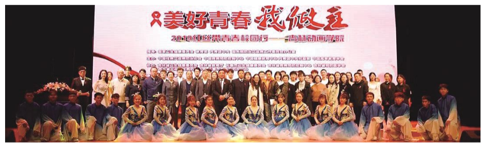
10月23日，吉林动画学院承办的2019“美好青春我做主”红丝带青春校园行活动在吉林动画学院艺术中心举行。

本报讯 为了广泛普及艾滋病防治知识，提高青年学生参与艾滋病防治工作的积极性和自我防范意识，10月23日，由中国性病艾滋病防治协会、中国疾病预防控制中心、中国健康教育中心、共青团中央权益部、中国高等教育学会主办，吉林省卫生健康委、吉林省教育厅、长春市卫生健康委、吉林省疾病预防控制中心、吉林省预防医学会、吉林省艾滋病性病防治协会、长春市疾病预防控制中心、吉林动画学院承办的2019“美好青春我做主”红丝带青春校园行活动在吉林动画学院艺术中心举行。