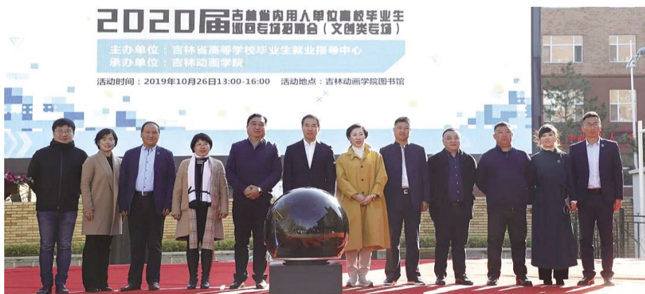
10 月 26 日,“创业有我 就在吉林”2020 届吉林省内用人单位高校毕业生巡回专场招聘会(文创类专场)在我校举行,与会领导合影留念。

本报讯 10 月 26 日,由吉林省高等学校毕业生就业指导中心主办、吉林动画学院承办的“创业有我 就在吉林”2020 届吉林省内用人单位高校毕业生巡回专场招聘会(文创类专场)在吉林动画学院举行。省教育厅副厅长许世彬、省高等学校毕业生就业指导中心主任唐洪丰莅临指导。吉林动画学院院长、党委书记、督导专员张炬,副院长、副校长刘欣等学校领导,3000 多名吉动学子以及来自省内外的 80 家文化创意产业用人单位参加了此次活动,招聘现场气氛火爆。