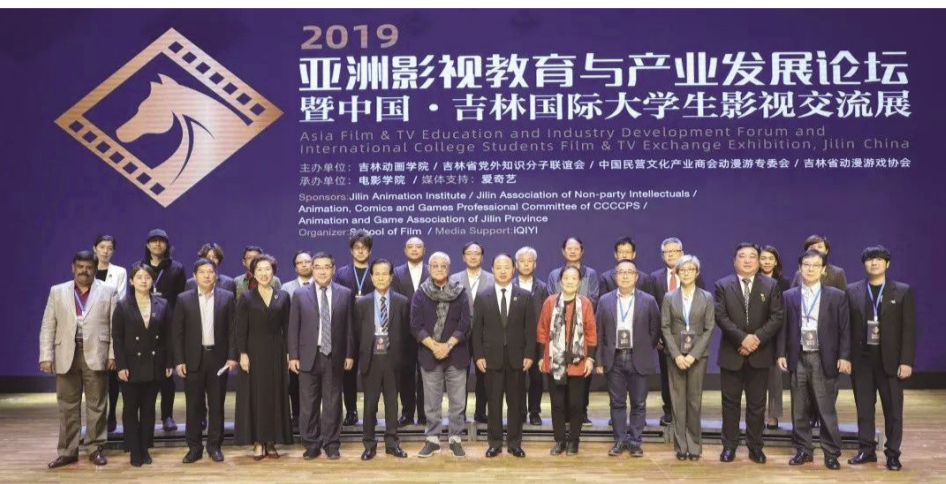
2019亚洲影视教育与产业发展论坛开幕,与会嘉宾合影留念。

作为本次论坛的重要嘉宾,来自国内外的影视界和教育界专家和学者有14位,他们是:中国知名电影艺术家、第34届香港电影金像奖最佳男配角获得者曾江,韩国电影人总联合会会长池相学,韩国 Signal Pictures 公司首席执行官官玟峨,韩国汉阳大学戏剧电影学科学科名誉教授,吉