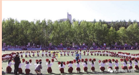
各分院学生团体操表演。