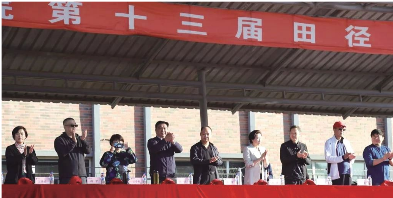
9月24日,吉林动画学院第十三届田径运动会火热开幕,校领导在主席台检阅方队。