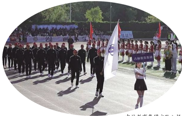
吉林教育集团方队入场。