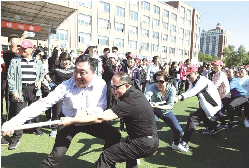
校领导参加拔河比赛。