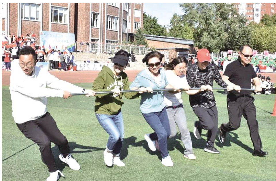
校领导参加旋风跑。