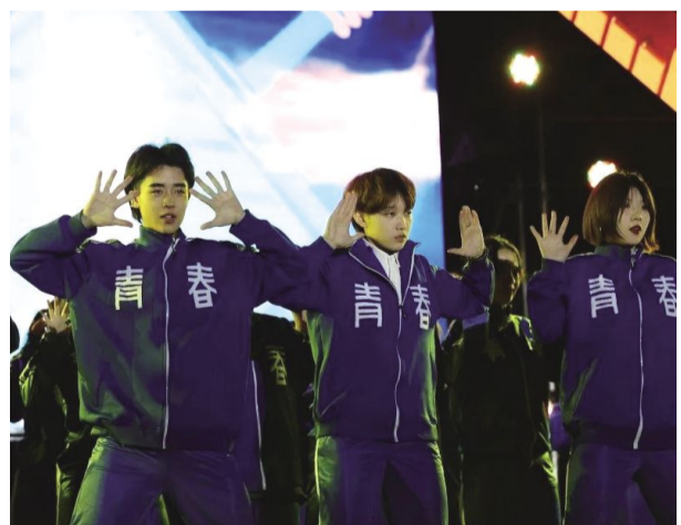
9月12日,吉林动画学院2019迎新晚会在下沉式广场隆重举行,一场精彩的视听盛宴,突显了我校文化发展的包容性与多元态势。

稚气的肩膀,点亮了大山里微弱的希望。我校阳光支教团的代表们娓娓道来他们的支教日记,“心中有宇宙,脚下有乾坤”是他们的代名词。纸短情长,所有的感动沉淀为诗行,呈给所有迎风的翅膀,呈给吉动支教团的每一位成员。