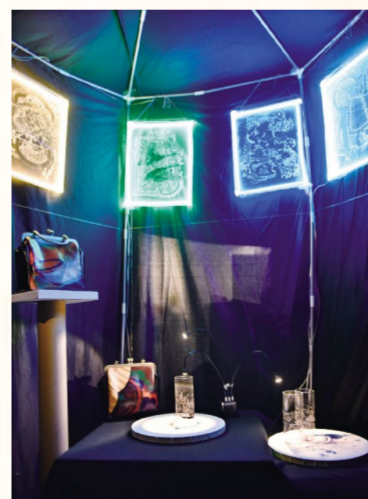
《九天飞梦》马头琴传说视觉设计左唤玲