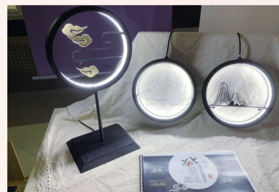
《祥云——新中式灯具设计》王珈玥 产品设计第三工作室