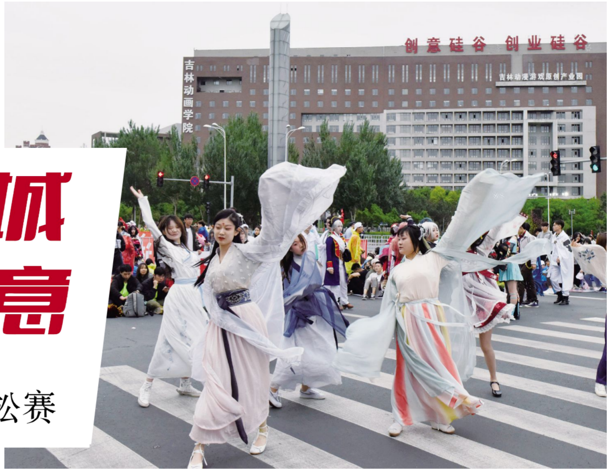
5月26日,我校cosplay社团舞动赛道,为长马助威。

本报讯 5月26日,第三届长春国际马拉松赛激情上演。吉林动画学院组织以cosplay二次元元素为主体的强大啦啦队倾力助阵。一场意料之中的雨,让吉动的助威声显得更加铿锵有力,画面感显得更加立体炫丽。