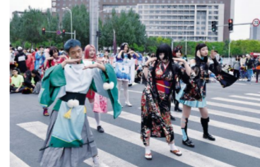
我行我“秀”