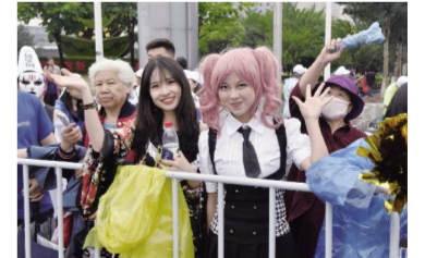
你猜我在看什么?