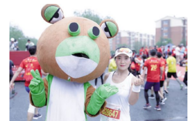
青蛙,你来!我们比心!