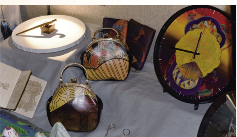
《九天飞梦》马头琴传说视觉设计左唤玲