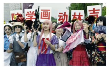
整“装”待发 刘庆发摄