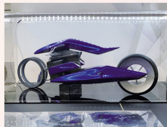
《新能源机车造型设计》叶旭明 产品设计第三工作室