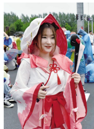
你是这条街最靓的coser