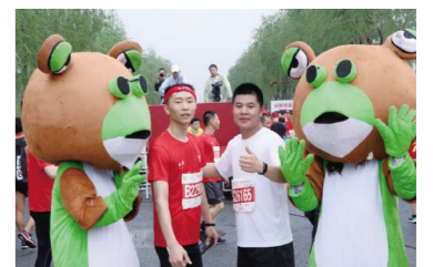
青蛙,你来!和我们拍张!