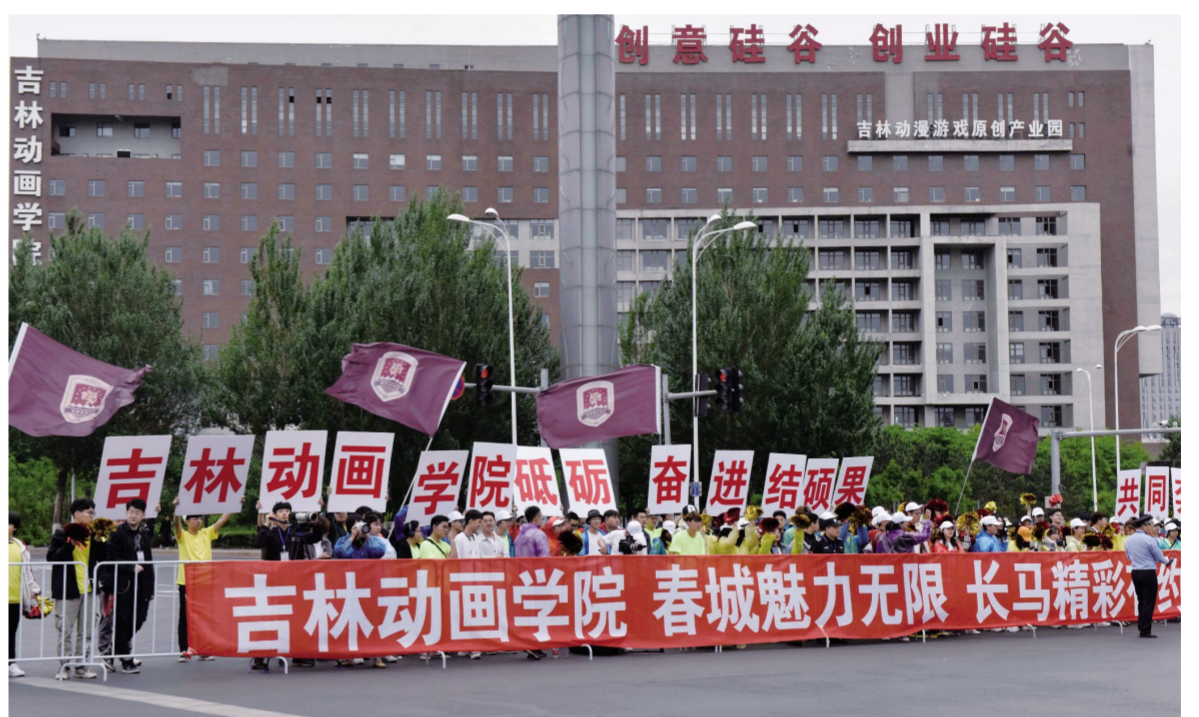
5月26日,我校千余名师生四地联动,共同为长马助威。