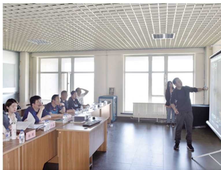
创新创业开放式项目评审现场,每位申报者进行项目展示、讲解。刘庆发 摄

一审核评估。专家评审团的组成涉及不同专业领域、学研产上下游不同阶段,阵容强大,治学严谨,接下来的时间,他们秉持专业与公平的态度,以创意为引领,以市场为导向进行审核评估。经过专家评审委员会通过的项目完成立项,并签订项目合同书。最终根据项目需求,我校为通过立项的项目提供相应的项目经费,以及办公空间、仪器设备、人力资源、市场渠道等支持。