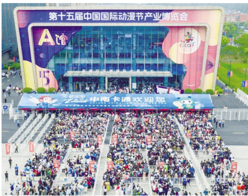
4月30日至5月5日,第十五届中国国际动漫节(CICAF)在杭州隆重举行。

2019年4月30日至5月5日,为期6天的第十五届中国国际动漫节(CICAF)在杭州滨江区白马湖动漫广场隆重举行。除了白马湖主会场,动漫节还在全市设立了12个分会场,举办论坛、商务、赛事、活动等五大版块,共计50余项丰富多彩的活动。吸引了包括迪士尼、暴雪娱乐、万代、Webtoon等在内的2645家中外动漫企业、机构参与,吉动文化艺术集团IP事业群也如往常一样率团参加了这场享誉国内外的动漫盛会!