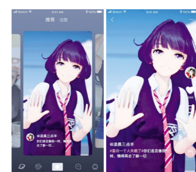
1.2版本的小宇宙首页推荐显示功能调整为卡片轮播。

话题功能开通。话题功能在小宇宙1.2版本中正式开通。在这个功能模块下,小宇宙的用户可以参与各式话题内容,与相同话题下感兴趣的小伙伴展开互动与交流。迸射出更多智慧的火花。