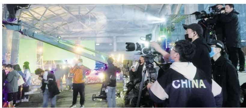
电影《梦想之门》于4月28日开机后,正在火热的拍摄中。

本报讯 5月10日,记者在电影学院拍电影棚看到,由吉林动画学院、吉林吉动文化艺术集团股份有限公司、吉林吉动禹硕影视传媒股份有限公司联合出品的电影《梦想之门》于4月28日开机后,正在火热的拍摄中。