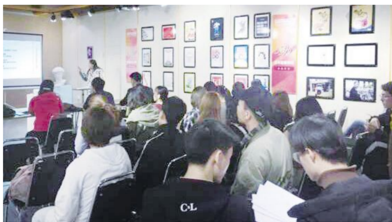
日前,文化产业商学院全面、积极、主动配合本次大赛项目申报工作。

成三个评审小组,在2019年4月17日-4月24日,对所有报名的38个项目进行初审,各项目负责人现场汇报非常积极踊跃,创业热情高涨,专家评审认真给出意见,观点犀利,掷地有声,而且给出了很多可行性、有指导性的建议。