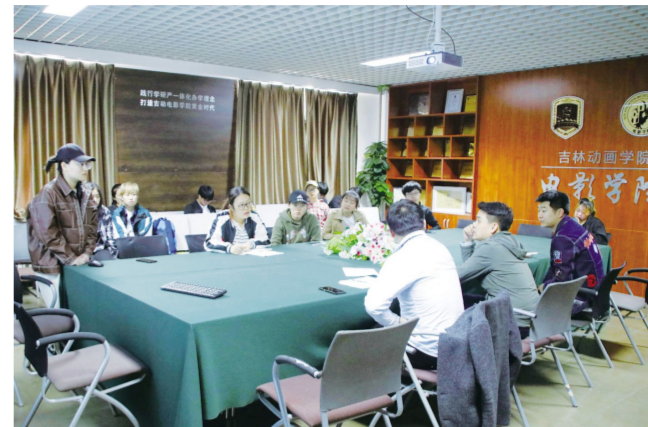
4月24日,我校电影学院“力行杯”创新创业大赛初赛,在F511多媒体教室准时拉开帷幕。

本报讯 4月24日,电影学院“力行杯”创新创业大赛初赛,在F511多媒体教室准时拉开帷幕。“草树知春不久归,百般红紫斗芳菲”,电影学院的师生们在这生机盎然的春天里,响应“大众创业,万众创新”的号召,尽情展露他们的激情。本次大赛旨在培养学生创新创业能力,营造学院双创氛围,为师生搭建双创的互创平台。