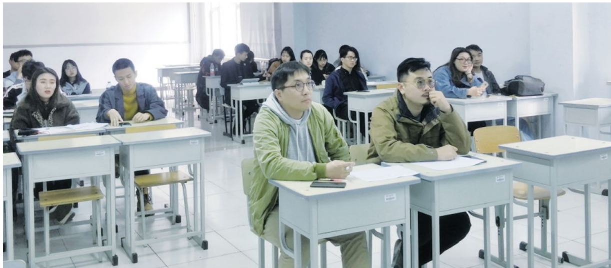
4月下旬以来,动画艺术学院创新创业大赛开展得如火如荼。

在项目遴选过程中,学院加强指导,严格把关。通过三轮评审及指导,从120个项目中遴选出30个项目推荐