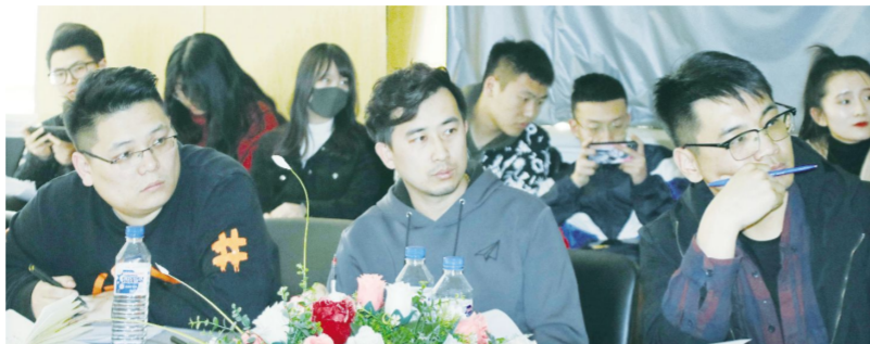
2019年4月24日,设计学院“力行杯”创新创业大赛初赛在B328拉开帷幕。

本报讯 为响应“大众创业,万众创新”的号召,深化设计学院创新创业教育,强化“专创融合”专业建设特色,推动创新创业教育与思想政治教育紧密结合、促进学院、专业“三全育人”和学生全面发展。 2019年4月24日,设计学院“力行杯”创新创业大赛初赛在B328拉开帷幕。