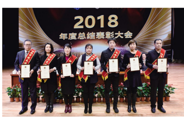
“先进中层管理干部”获奖代表。