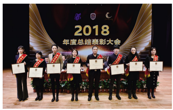
“吉林动画学院先进集体”获奖代表。