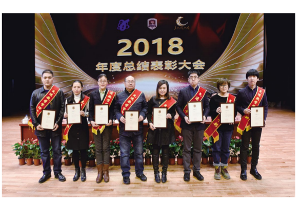
“先进平台管理干部”“先进教学管理干部”获奖代表。