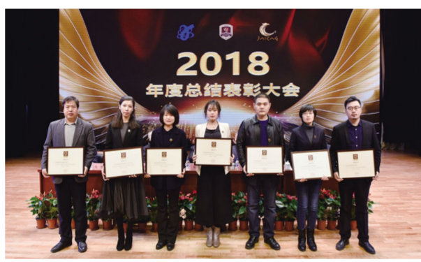
教学单位、行政职能部门下辖先进集体获奖代表。