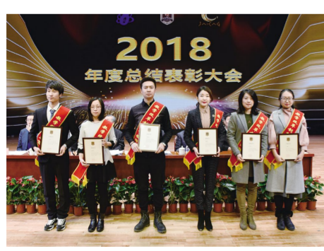
“教学改革创新型教师”获奖代表。