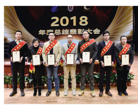
“优秀双师型教师”获奖代表。