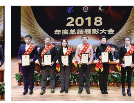
“优秀外聘教师”获奖代表。