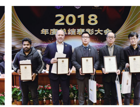
“优秀外籍专家”获奖代表。