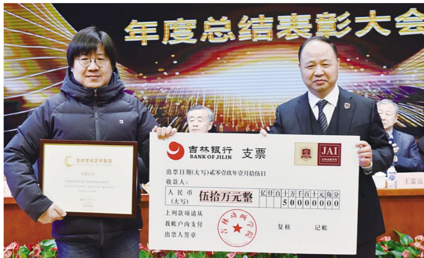
“小宇宙动画生活化平台”项目开发团队北京项目组获“2018年董事长年终奖”。