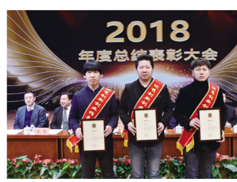
“优秀创新创业指导教师”获奖代表。