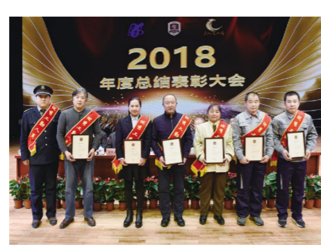
“优秀工勤人员”获奖代表。