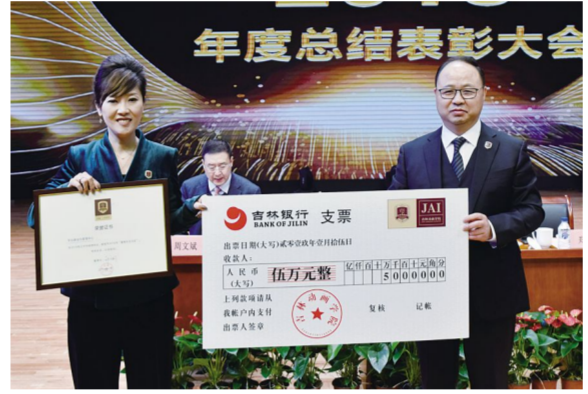
平台建设与管理中心(含创意产业创新创业孵化平台)获得本年度董事长“龙马奖”。