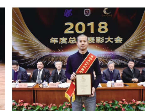
吉动文化艺术集团股份有限公司“技术创新奖”获奖代表。