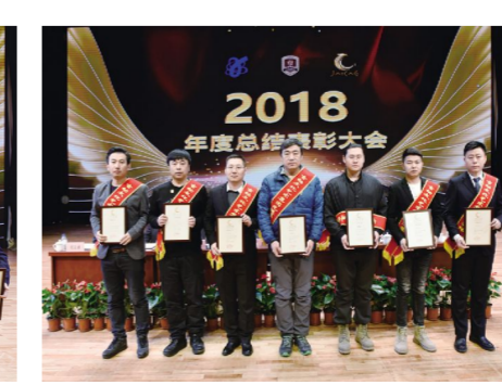
“吉动文化艺术集团股份有限公司先进集体”获奖代表。