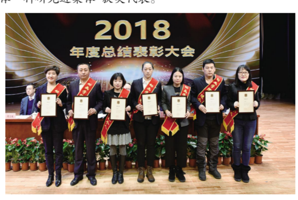
“吉林动画学院先进个人”获奖代表。