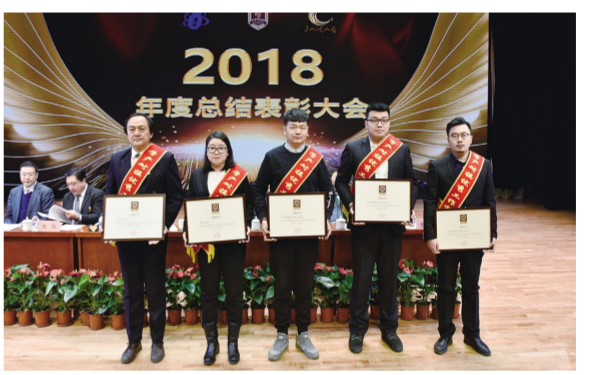
“产学研对接优秀工作室”获奖代表。