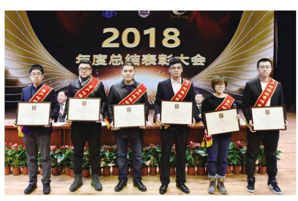
“产学研对接优秀项目组”获奖代表。