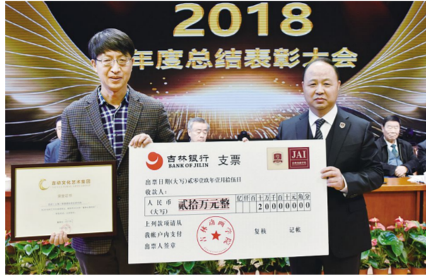
吉动(上海)智慧虚拟现实研究院获得2018年“董事长鲁班奖”。