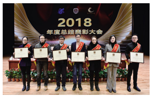
“产学研一体化推进先进集体”“教学改革创新先进集体”“科研先进集体”获奖代表。