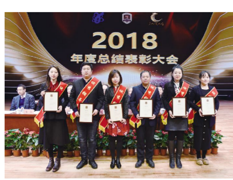
“优秀辅导员”获奖代表。