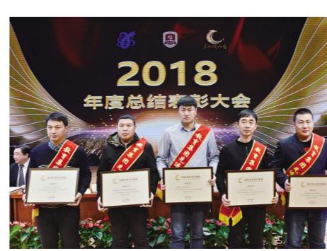
“吉林省教育实业集团股份有限公司先进集体和先进个人”获奖代表。