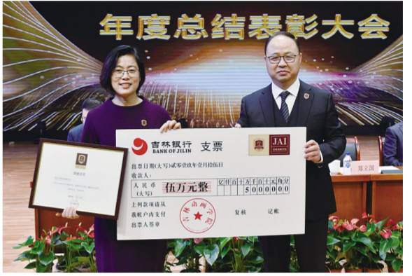
招生与就业发展中心获得本年度董事长“龙马奖”。