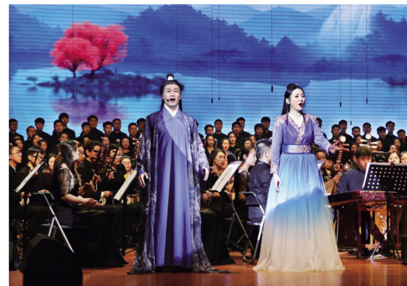
上图:12月6日19时,2018年度国家艺术基金大型舞台剧和作品资助项目大型民族交响神话诗剧《大爱长白》于我校文化艺术中心国际会议厅隆重演出。左图:校领导与演职人员合影。

邂逅,相知迢迢。”二胡、提琴、琵琶以及扬琴等乐器的完美配合,将表情达意演绎到了极致,引得观众席传来连绵不绝的掌声。“长白青青,此恋绵绵;天池滟滟,此情涟涟。”在这样舒缓动人的乐声中,两人许下永不分离的诺言。