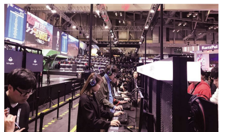
第十四届韩国G-STAR国际游戏展现场。

导向,为形成品牌IP构建了标准。 考察团与韩国手机游戏协会会长交流了2019年共同举办吉林动画学院大学生游戏制作大赛的意向。针对目前韩国游戏行业发展状况双方探讨了能与吉林动画学院进行国际产学研合作的企业名录,并与部分企业达成初步共识。 同时,考察团参与多场游戏研讨会,针对游戏策划、游戏美术、游戏编程等针对不同层