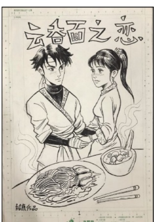
▲陈绍康作品《云吞面之恋》