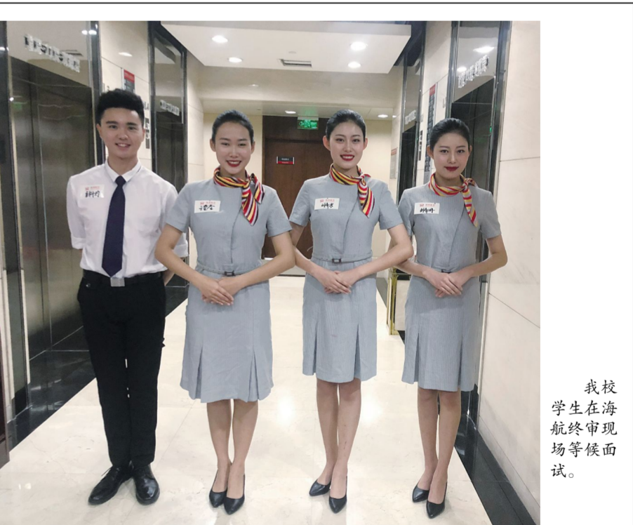
我校学生在海航终审现场等候面试。

本次活动不仅为即将毕业的的优秀大四学生与在校学生之间搭建了沟通交流的桥梁,也为在校的学弟学妹们树立了榜样,指明了前行的方向。(洪啸鹏 方彦)