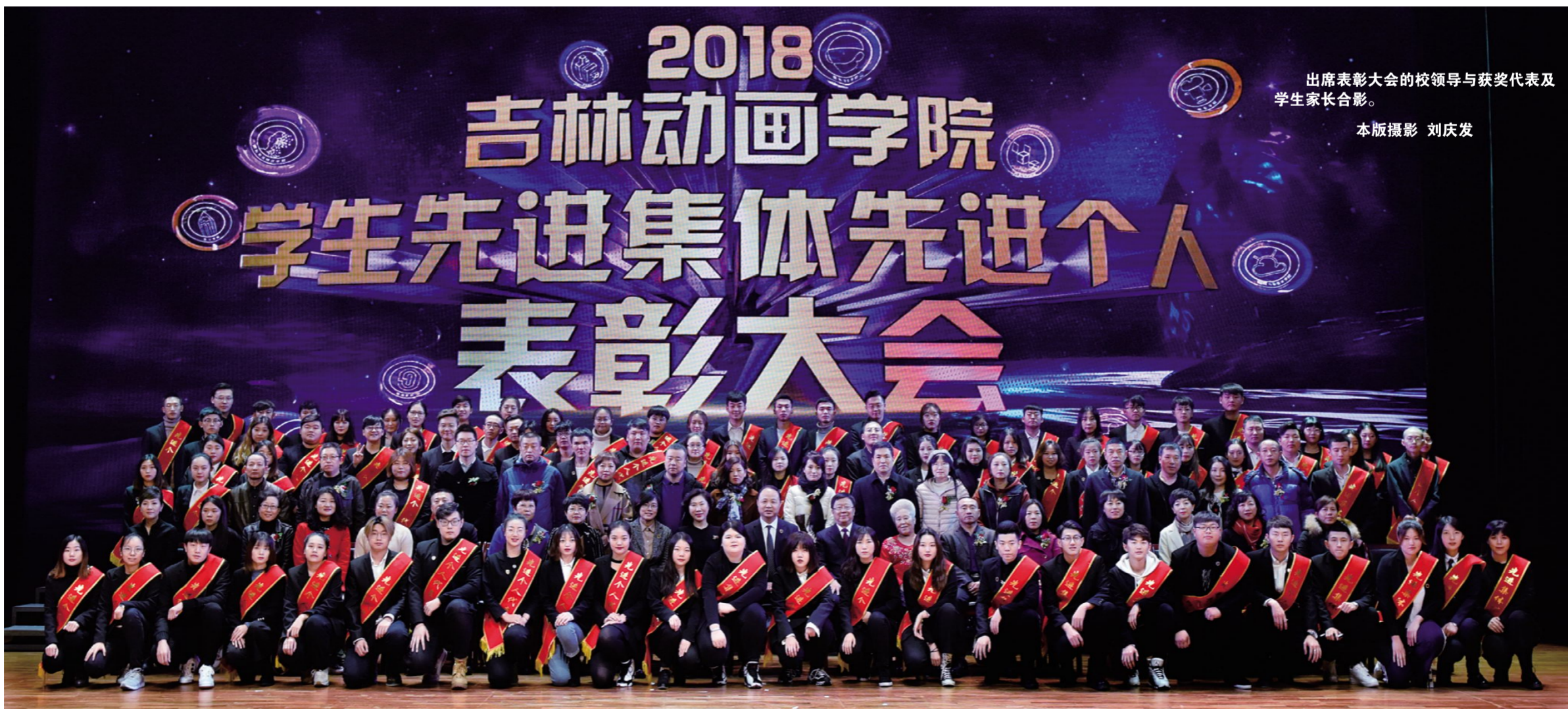
出席表彰大会的校领导与获奖代表及学生家长合影。