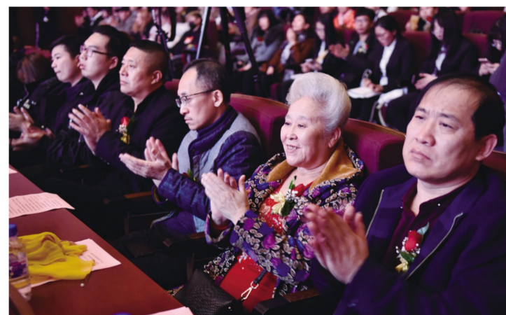
参加表彰大会的家长代表看到孩子们取得的成绩,十分欣慰。