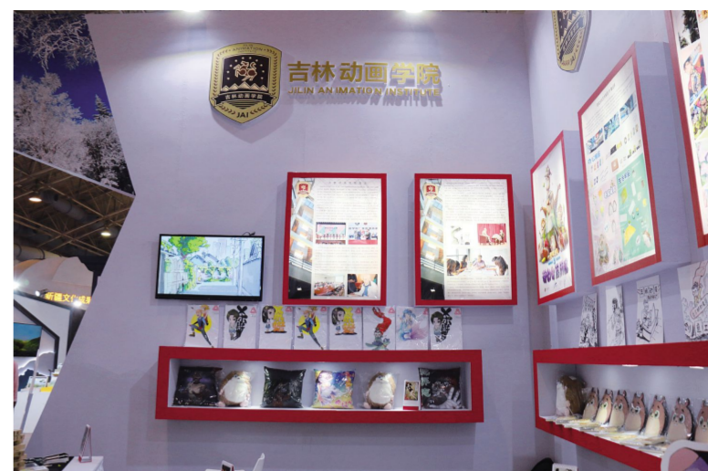
左图:10月25日,第十三届中国北京国际文化创意产业博览会在北京中国国际展览中心盛大启幕。 上图:吉动文化艺术集团参展呈现品牌亮点。