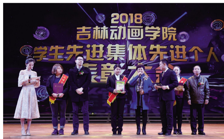
获奖学生家长代表感谢学校为孩子搭建了先进的学习平台。