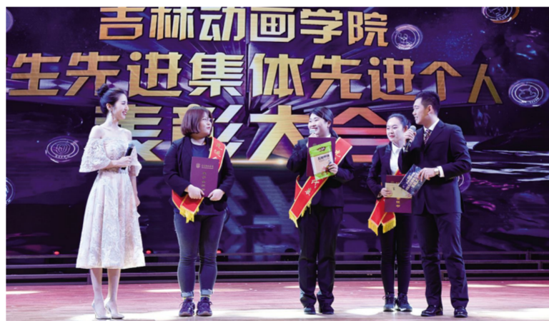
获奖学生代表讲述对学校的感恩之情。