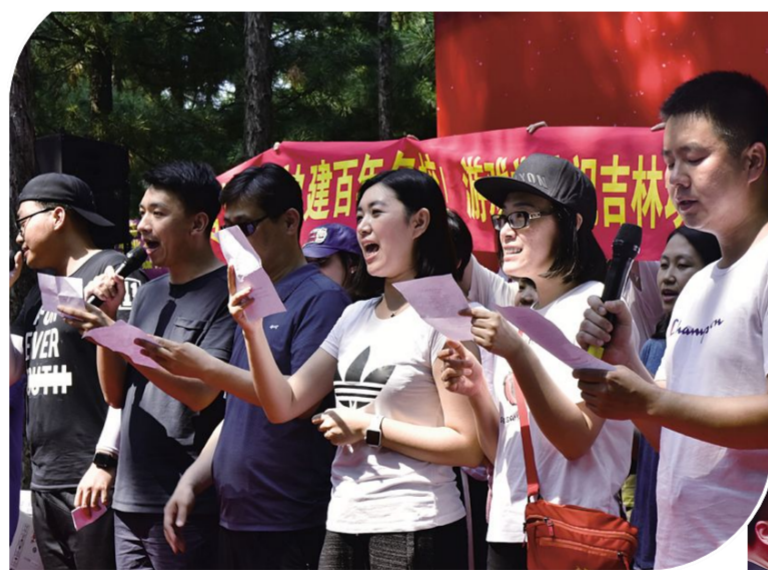
精彩演出抒发爱校情。