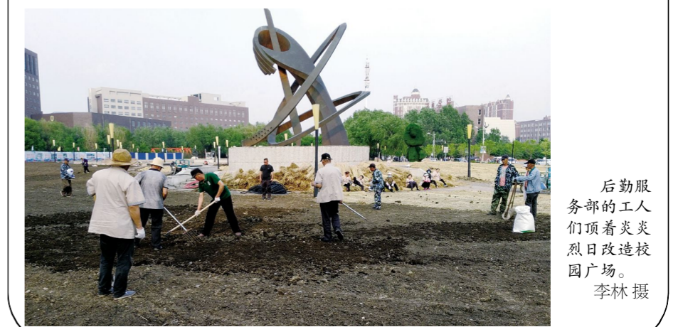
后勤服务部的工人们顶着炎炎烈日改造校园广场。

由于改造工程时间紧任务重,工人们最早5点开工,晚上有时要忙到半夜两点才收工,平均每天用工60余人次,在最短的时间内把整个下沉广场改造完毕。在修整路面工作中,2名维修工人用5天时间俯身劳作,对学校所有的柏油路面进行了重新灌溉,共浇灌15桶青圆完成了工作任务。 为做好卫生保障工作,25名保洁员每日轮流抽出两小时休息时间,会同绿化工人参与校园除草工作。从四月初开始,后勤工人们加班加点的完成领导布置的工作任务,为学校文明美好的校园环境贡献力量。 (胡晶)