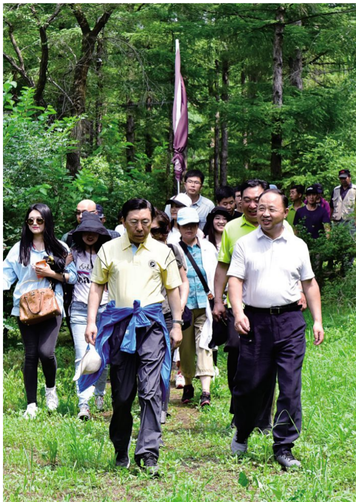
穿林踏绿,来到双阳校区

拥抱双阳新校区活动圆满结束了,林荫下,草地上,留下了吉动人的欢歌笑语,在吉林动画学院发展的进程中,也留下了每个吉动人的付出与努力…… (于明明)