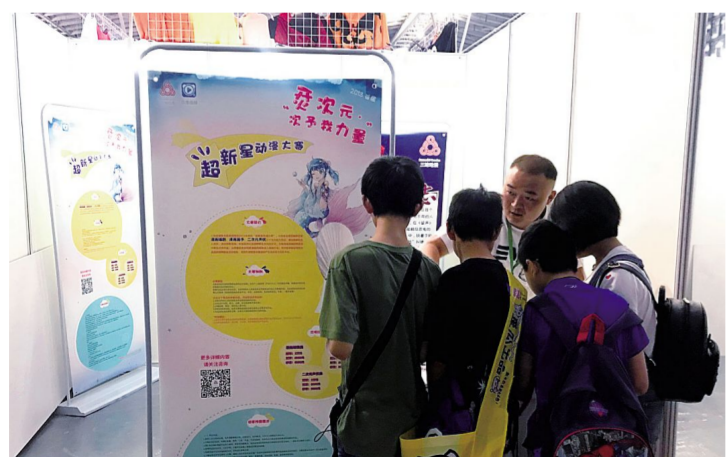
左图:7月5日,第十四届中国国际动漫游戏博览会在上海世博展览馆展开。“三昧动漫”携多部优秀作品参展,受到大批漫迷粉丝的追捧。

本届 CCG EXPO 处处弥漫着中国味道,众多原创“国漫”作品人气旺盛,为广大动漫游戏爱好者献上了一场高水准文化消费盛宴。通过此次参展“三昧动漫”不仅得到了一次强有力的宣传,同时也打响了“三昧”的动漫品牌建设。未来“三昧动漫”将为二次元的发展创造更多可能,打造具有标识度的国漫品牌。(史宸)