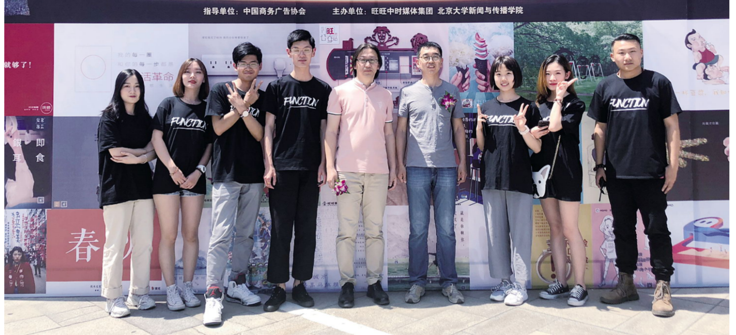
上图:参加“第27届时报金犊奖颁奖典礼”的我校师生合影。

讲学中,西蒙那导演使用Maya软件具体操作指导学生动画制作,一对一指导学生项目中layout的制作,给每一个学生提出修改意见。经过近两周的工作,《北极熊》项目进展顺利,完成了layout和部分动画镜头的制作,并在6月22日下午进行了项目成果的展示。西蒙那导演肯定了学校开放式国际化的办学理念,对学生的实践能力和认真的学习态度给予高度认可,两周结束后,师生共同汇报了教学成果,并合影留念。