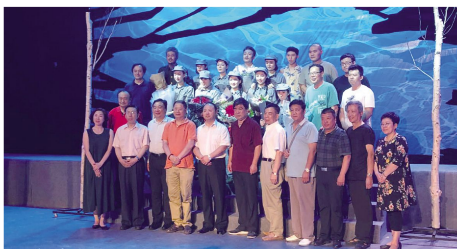
下图:校领导与话剧《追梦年华》演员合影。

电影学院表演系目前已连续三届获得吉林省大戏节导演、编剧及剧目一等奖,有一定的创作及演出基础。每年暑期进行大戏节的创作和排演已成为电影学院的传统,师生对于大戏有着极大的热情和渴望,此次原创话剧期望能够通过作品创作带动教学、实践和成果积累,将原创剧目推向业界和全国。(黄春)