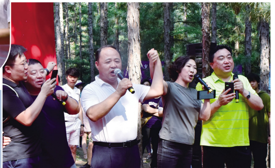
共同高歌《真心英雄》。