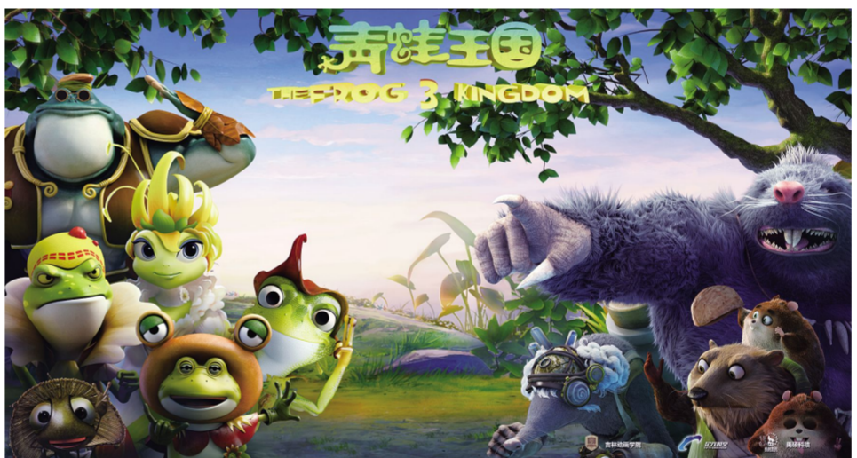
左图:3D动画电影《青蛙王国之奇幻女王历险》海报。 资料图片