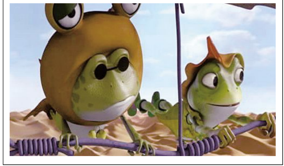
下图:《青蛙王国3》人物漫画形象。