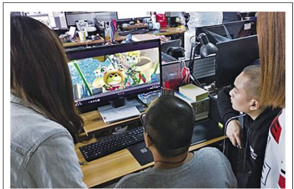
三昧动漫设计公司漫画事业部担纲《青蛙王国3》人物角色漫画设计工作。