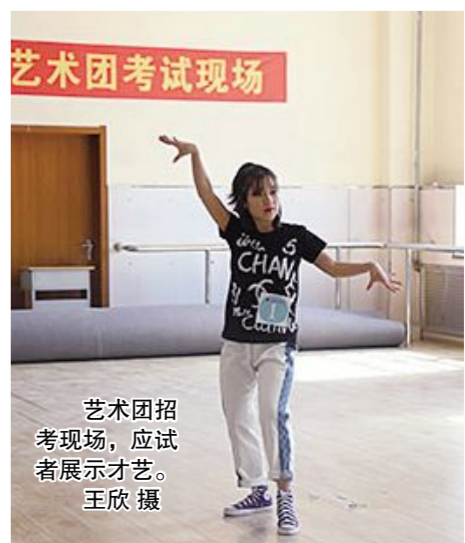
艺术团招考现场,应试者展示才艺。